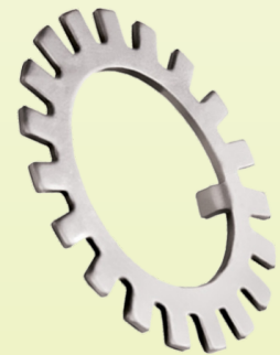
Arandela de Traba