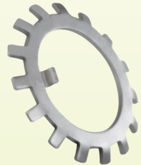
Arandela de Traba