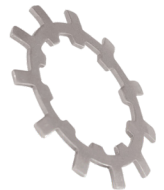
Arandela de Traba

PIEZAS PARA TRACTORES Y MAQUINAS AGRICOLAS