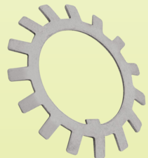
Arandela de Traba