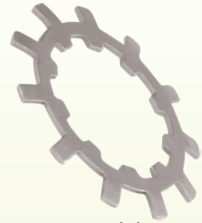
Arandela de Traba