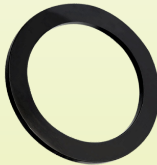
Anillo de Empuje