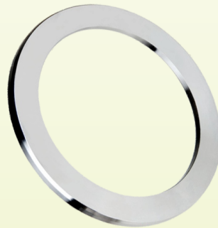
Anillo de Empuje