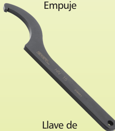
Llave de Gancho