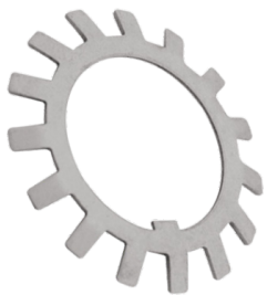
Arandela de Traba