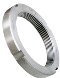
Porca de Fixação