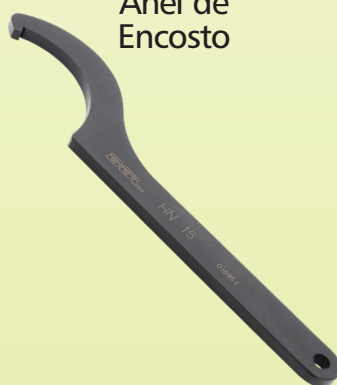
Chave de Gancho