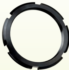
Porca de Fixação