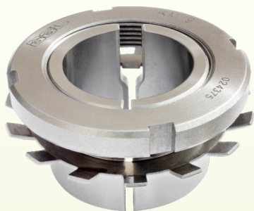
Bucha de Fixação Bipartida