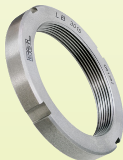
Porca de Fixação