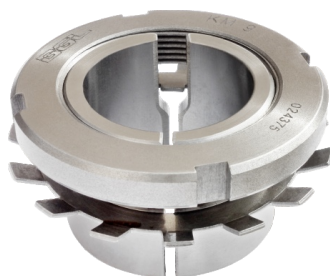
Bucha de Fixação Bipartida